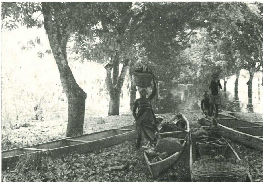
Abb. 3 Fischer am Volta-See (Kete Krachi)