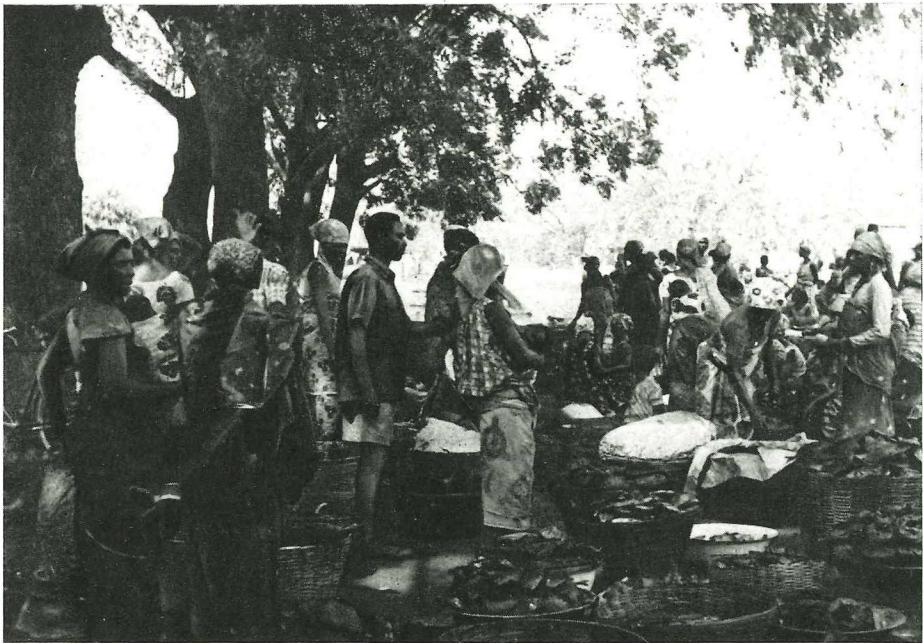
Abb. 2 Marktleben in Kete Krachi

Den Archivstudien in Accra schlossen sich Feldarbeiten in Kete Krachi, Salaga und Kumasi an. Für diese Wahl waren ausschließlich die mit der Geschichte des Hausahandels in diesem Gebiet verbundenen Gegebenheiten ausschlaggebend. Salaga, die wichtigste Handelsstadt im Gonjareich, war bis 1892 auch ein bedeutendes Zentrum des Hausahandels, wo die Produkte des Nordens (Vieh, Baumwollwaren und Schibutter), des Südens (Salz und Kolanüsse) und des Ostens (Baumwoll- und Lederarbeiten sowie verschiedene andere gewerbliche Erzeugnisse) gegeneinander ausgetauscht wurden. Nach den inneren Wirren im Gonjareich im Jahre 1892 verfiel Salaga, und Kete Krachi — damals auf dem Territorium der Togokolonie gelegen, seit 1957 jedoch zum